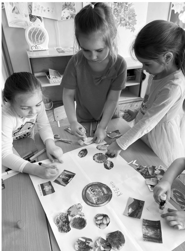
Фото 1. Пример создания интеллект-карты на занятии